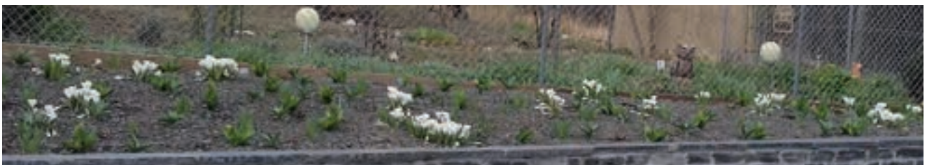
Am Friedhofsaufgang: Vorboten einer erwachenden Natur