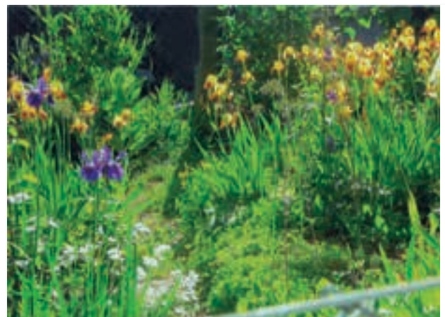
Im Brubacherweg: Sommerblumen im Bauerngärtchen