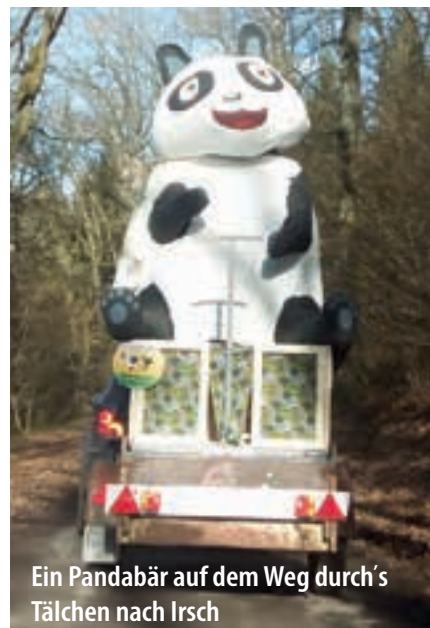
Ein Pandabär auf dem Weg durch's Tälchen nach Irsch