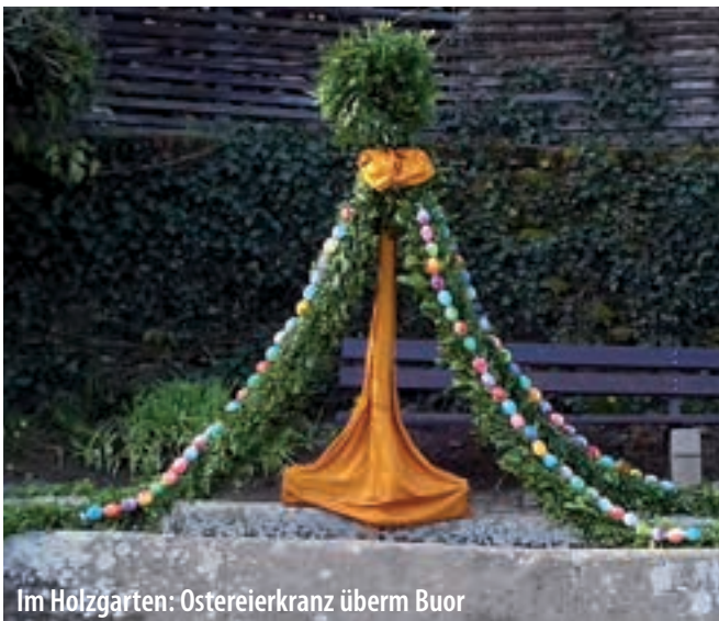
Im Holzgarten: Ostereierkranz überm Buor