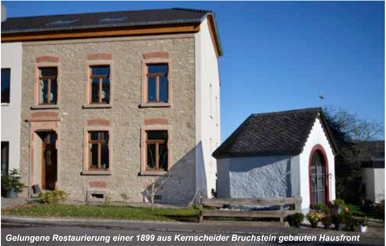
Gelungene Restaurierung einer 1899 aus Kernscheider Bruchstein gebauten Hausfront

Wo: Anfeuerungsstand der SSG Kernscheid in der Fankurve Ecke Brotstraße/Konstantinstraße Glühwein, heißer Tee, heiße Würstchen, lockere Laufpausen – Gespräche.